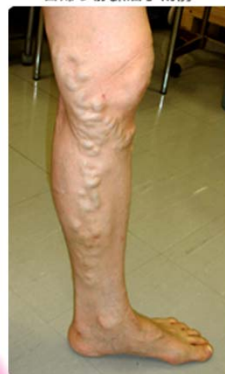
日帰り静脈瘤手術前